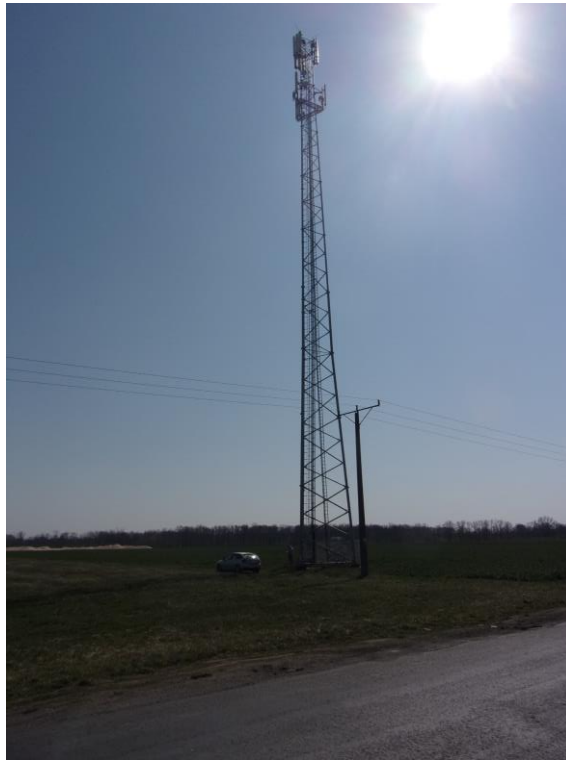
Zał. nr 1: Widok ogólny instalacji radiokomunikacyjnej.